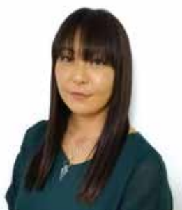
能登島ビーチリゾート Dolphin Smile & iluCafe ドルフィンガイド