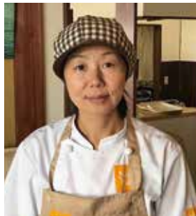
能登パン オーナーシェフ

夢であった、イルカ×子供との生活を両立させるため妊娠を機に「未婚の母貯金0円スタート!」で自営業を開始。今では大好きなイルカと子供に囲まれ毎日楽しく生活している。