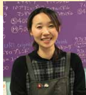
coffee KUKURI コーヒーマイスター

2013年 スタッフとして働いていた海辺のベーカリーを引き継ぎ形で「能登パン」を開業。生まれ育った能登町で念願の店を持ち、美しい海を眺めながら仕事ができる幸せを感じる日々。珠洲の塩や柳田のブルーベリーなど、豊かな能登の食材を生かした能登ならではのパンを提供している。