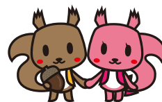
北海道信用保証協会PRキャラクター オールエンくん シエンちゃん

FAXの場合、参加申込書にご記入のうえ下記FAX番号までお送りください。 メールの場合、参加申込書の情報を本文にお書きのうえ、下記メールアドレスまでお送りください。受付後、担当者からメールにてご連絡いたします。